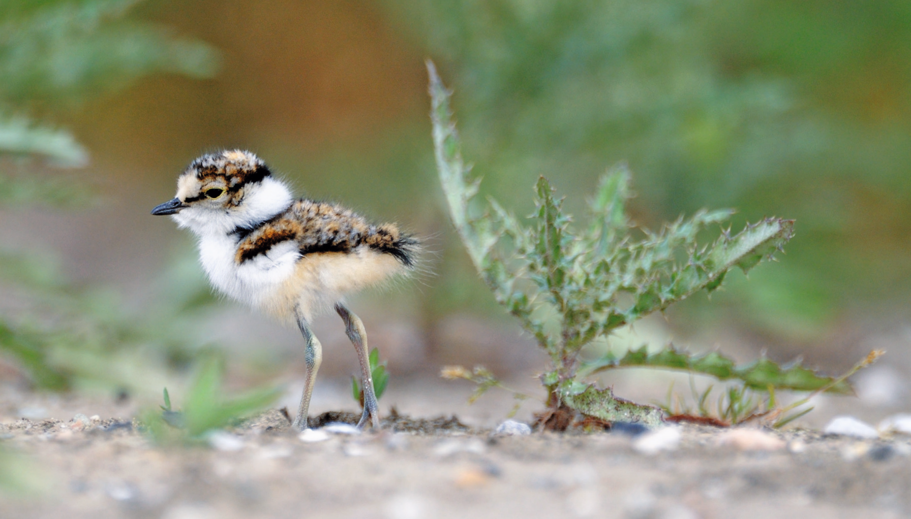
▲ Flussregenpfeifer sind echte Pioniere. Sie brüten oft auf Baugeländen, manchmal mitten in der Stadt. (Flussregenpfeifer; Nikon D300 mit AF-S Nikkor 600 mm f/4; 1/1000 s; Blende 4.8; ISO 280; vom Reissack)

Deutscher Avifaunisten (DDA) e.V. herausgegeben wurde. Mit über 800 Seiten liefert das Werk, das in zehnjähriger Arbeit entstand, einen umfassenden Datenfundus.