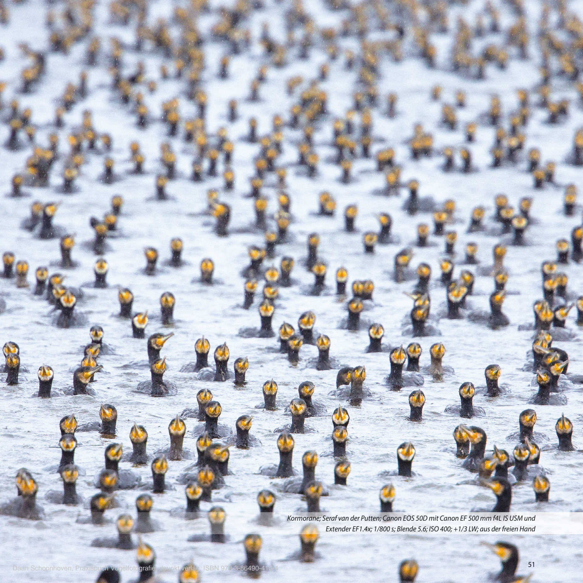
Kormorane; Seraf van der Putten; Canon EOS 50D mit Canon EF 500 mm f4L IS USM und Extender EF1.4x; 1/800 s; Blende 5.6; ISO 400; +1/3 LW; aus der freien Hand